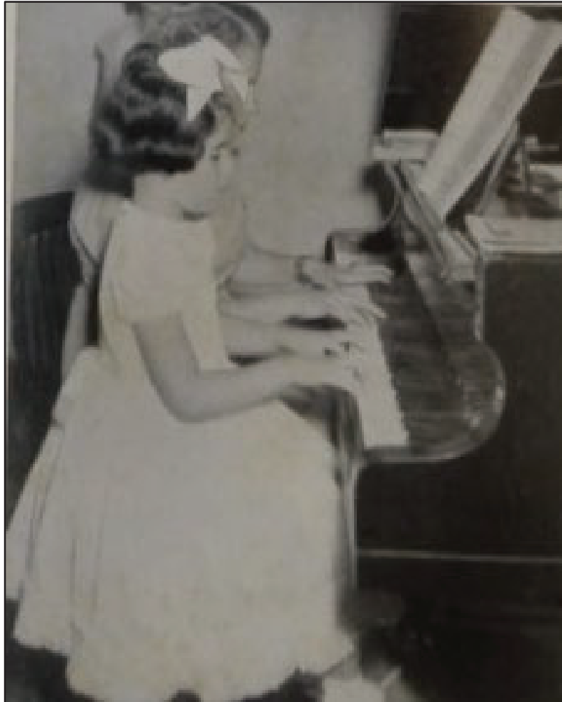
Figura 2: Aula de piano na Biblioteca Infantil