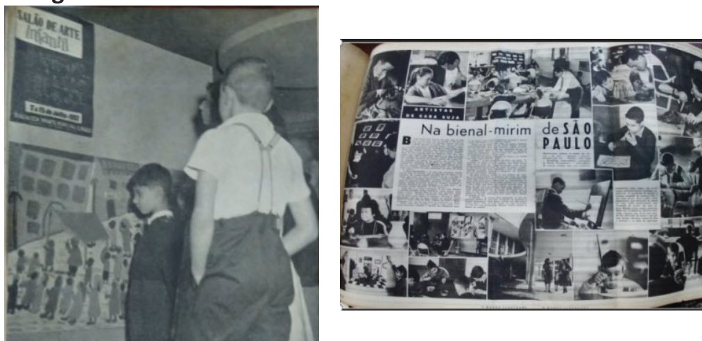
Figura 5: Salão de Arte Infantil e Bienal Mirim de São Paulo