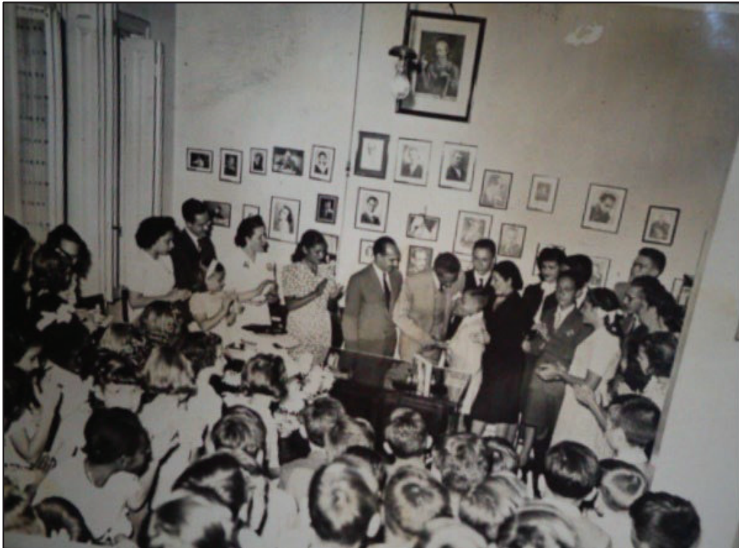
Figura 1: Inauguração dos retratos de Belmonte e de Mário Donato - 1943 9