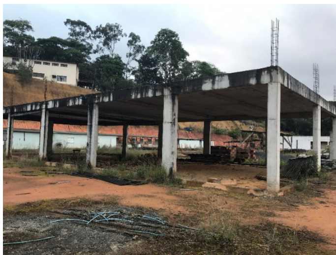
Figura 6 - Escola Técnica Município de Viana.