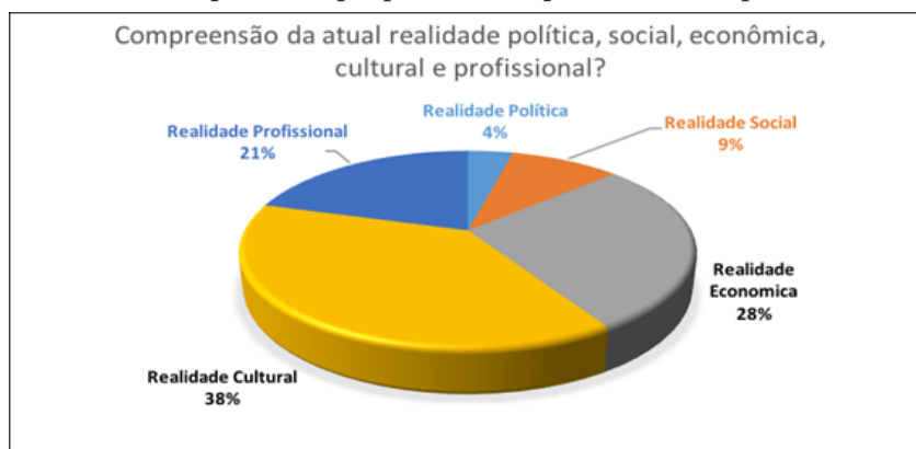
Gráfico 1 - Compreensão proporcionada pela formação profissional (%)

Obtivemos também relatos que evidenciaram a relevância da formação técnica para compreender a realidade política, social, econômica, cultural e profissional , assim explicitadas: