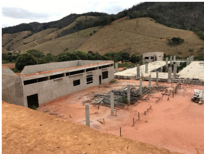
Figura 4 - Escola Técnica Município de Afonso Cláudio