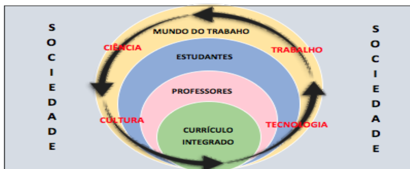
Figura 1 – Articulação realizada através do currículo escolar

Para configurar um currículo integrado nessa perspectiva é necessário a compreensão dos professores sobre a relação conteúdo e forma na dimensão do ensinar e aprender, o envolvimento e apreensão pelos estudantes na sua relação enquanto destinatário do saber sistematizado e a possibilidade de inserção dos estudantes ao mundo do trabalho com aplicação de tecnologias sociais envolvido de forma circular e espiralada com a qualificação do conhecimento através da ciência, cultura, tecnologia e trabalho. A proposta curricular desenvolvida pela Educação Profissional da Bahia transita por este modelo de integração representado na figura 1, o que demonstra a articulação de algumas categorias no currículo integrado.