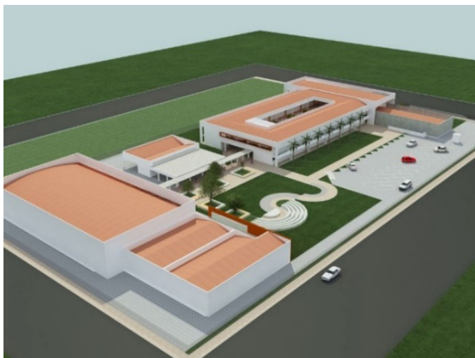
Figura 2 - Vista aérea de escola técnica - padrão definido pelo MEC/FNDE.