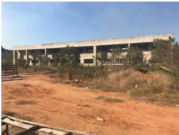
Figura 5 - Escola Técnica Município Iúna.