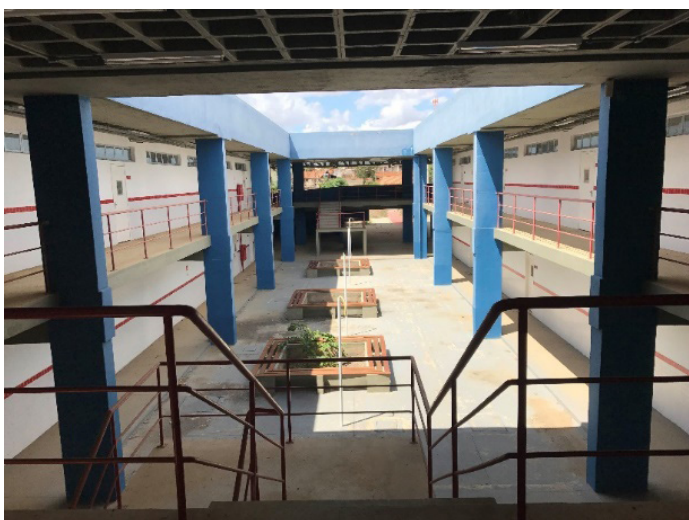
Figura 3 - Escola Técnica Município de Baixo Guandu.

todas as obras ocorreram aditamentos de prazos e de valores, assim como irregularidades nas construções, constatadas pela Controladoria Geral da União (CGU) e pelo Tribunal de Contas do Estado do Espírito Santo (TCEES). A Vila Construtora Ltda. foi contratada para construir a escola de Baixo Guandu, primeira a ser iniciada (novembro/2012) e que teve a maior porcentagem de execução realizada até o momento (90%). A obra de Baixo Guandu teve um termo aditivo que aumentou o valor em 22,13% e vários termos aditivos prorrogando os prazos.