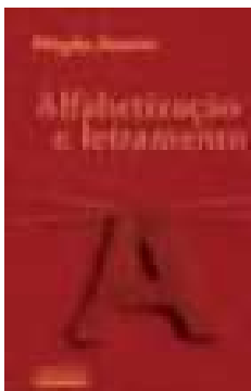
Figura 8 – Capa de Alfabetização e letramento (2003)

Em 2003, Magda Soares teve publicado o livro Alfabetização e letramento , no qual reúne seus principais artigos sobre alfabetização, letramento e ensino da língua portuguesa, publicados ao longo da década de 1990, fazendo (re)leituras atualizadoras desses artigos, dentre os quais se encontra “As muitas facetas da alfabetização” (1985).