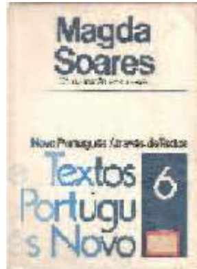
Figura 3 – Capa de Novo português através de textos (1982)