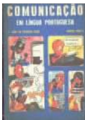
Figura 2 – Capa de Comunicação em língua portuguesa (1972)

Em 1973, essa educadora teve publicada uma nova coleção de livros didáticos para o ensino de língua portuguesa. Trata-se da coleção Comunicação em língua portuguesa , publicada pela Editora Bernardo Álvares (MG), também destinada aos alunos da 5ª, 6ª, 7ª e 8ª séries do ensino de 1º grau.