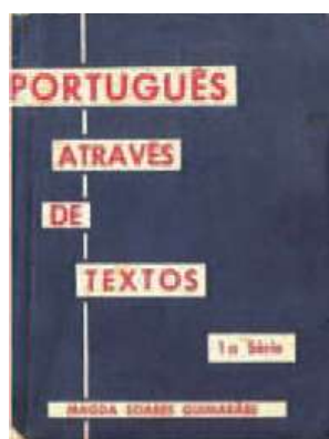
Figura 1 – Capa de Português através de textos : 1 a . série [1967]

De acordo com Soares (1991), essa coleção foi organizada a partir da compreensão de que a língua é “essencialmente instrumento de comunicação”, e a comunicação é que nos torna seres humanos; justifica-se, assim, o estudo da comunicação por meio de palavras.