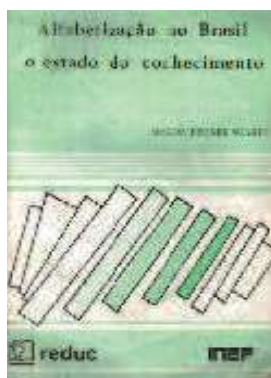
Figura 5 – Capa de Alfabetização no Brasil: o estado do conhecimento (1989)

O terceiro desses textos — Alfabetização no Brasil: o estado do conhecimento —, foi publicado em 1989, pelo Instituto Nacional de Estudos Pedagógicos (INEP).