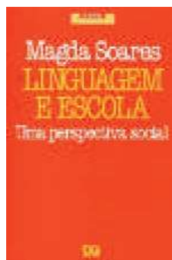
Figura 4 – Capa de Linguagem e escola (1986)

O segundo é o livro Linguagem e escola: uma perspectiva social , com 1ª. edição em 1986, pela Editora Ática (SP).