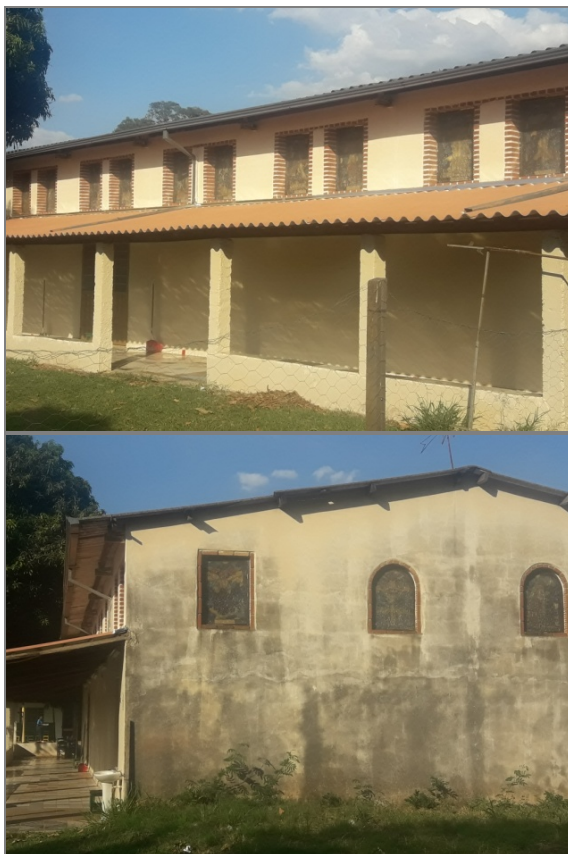
Figura 1 - Imagens da Creche São Jerônimo Emiliani (a).