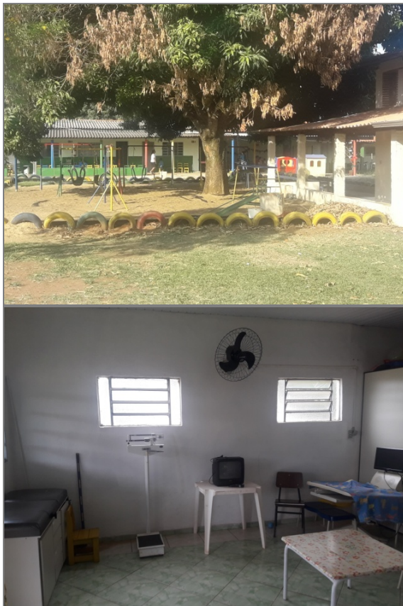
Figura 2 - Imagens da Creche São Jerônimo Emiliani (b).